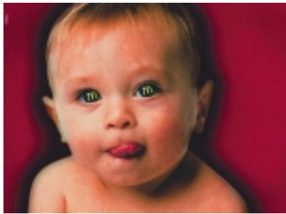
Abb. 3: Werbemotiv von McDonald's Österreich 2001 [22]