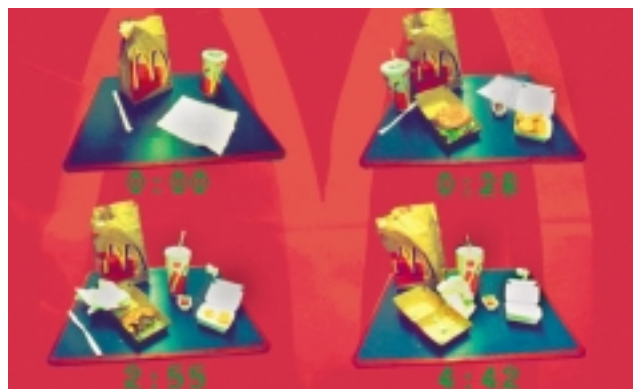
Abb. 4: Vier Minuten und 42 Sekunden [24]

Märkte analysiert und Produkte zielgenau entwickelt. Und diese Grundprinzipien ökonomischen Handelns gelten zunehmend für alle im Wettbewerb stehenden Lebensmittelanbieter – also auch für Slow Food. Parmaschinken etwa ist ein traditionelles, schmackhaftes