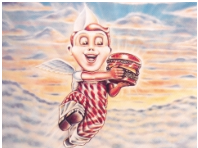
Abb. 2: Der Hamburger: Eindringling oder Himmelsstürmer? [10]

Zur gleichen Zeit veränderte sich in der Bundesrepublik aber auch die gehobene Küche, etablierte sich neuerlich ein Bereich von Slow Food. Nachdem seit den frühen 1960er Jahren italienische, jugoslawische und griechische Gaststätten entstanden, gewann seit Anfang der 1970er Jahre die französische „Nouvelle Cuisine“ an Be-