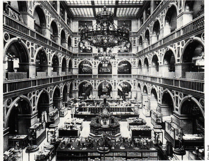
Die Strumpfabteilung des Warenhaus Wertheim; Foto von 1906