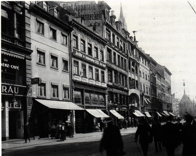
Blick in die Kaufingerstraße in München um 1905