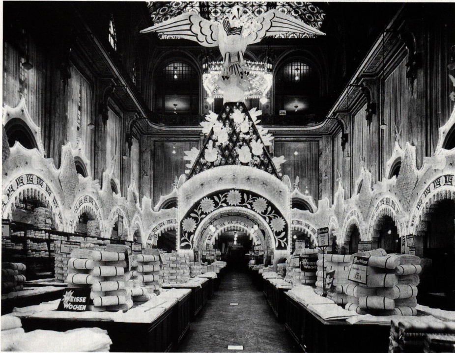
„Weiße Woche“ beim Kaufhaus Tietz in Berlin