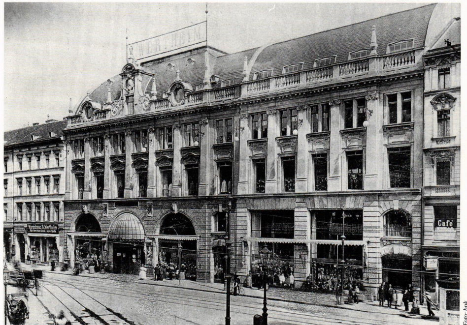
Abb. 1: Fassade des Warenhauses A. Wertheim in Berlin-Kreuzberg; Foto um 1905 (Architekt A. Messel, Bauzeit 1893/94).

Das Warenhaus der Jahrhundertwende schuf einen neuen Raum für Einkauf und Absatz. Grenzloser Konsum schien möglich. Die Faszination, die von den Warenhauspalästen dieser Zeit mit ihren berstenden Verkaufstischen und prächtig dekorierten Waren ausging, bietet einen guten Anknüpfungspunkt, um Unterschiede und Gemeinsamkeiten des damaligen und heutigen Konsums sinnfällig zu machen. Zugleich kann das Thema helfen, der im Unterricht meist unter sozialen und wirtschaftlichen Aspekten behandelten Industrialisierung neue Gesichtspunkte abzugewinnen.